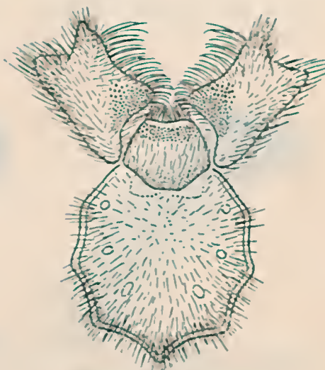
Fig. 6 Butantania hirsuta , g. n., sp. n. Es- terno, peça labial e ancas dos palpos